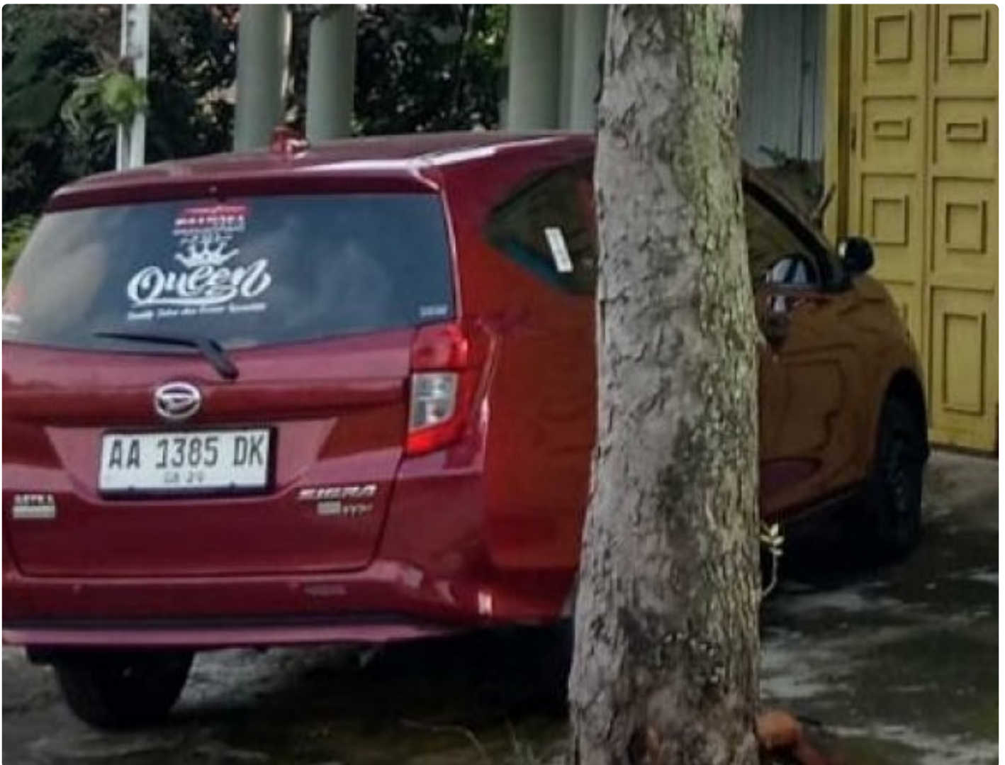
Foto: Mobil yang digelapkan

BOYOLALI - Sebuah laporan penggelapan mobil merek Daihatsu Sigra dengan nomor polisi AA 1385 DK mencuat di wilayah Boyolali, setelah korban melaporkan kejadian tersebut kepada pihak kepolisian. Kasus yang terjadi pada Kamis (2/1/2025) sekitar pukul 13.00 WIB di Dukuh Tegalsari RT 02/RW 02, Tambak, Mojosongo, Boyolali , ini melibatkan kerugian hingga Rp160 juta.